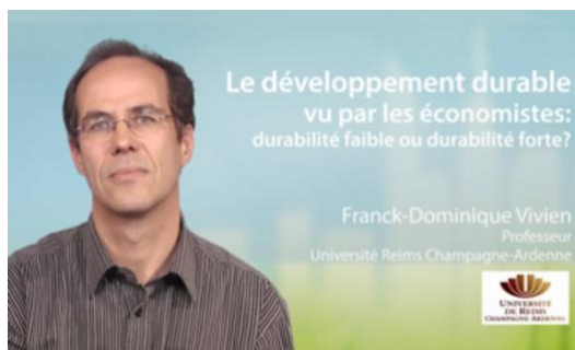
Ressource labellisée UVED

Identifier, sur un plan théorique, les différentes conceptions de la durabilité